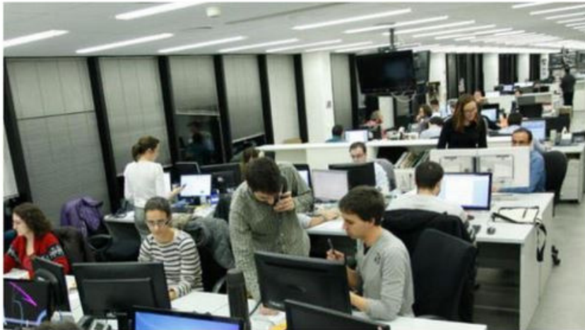
Redacción de El Confidencial.