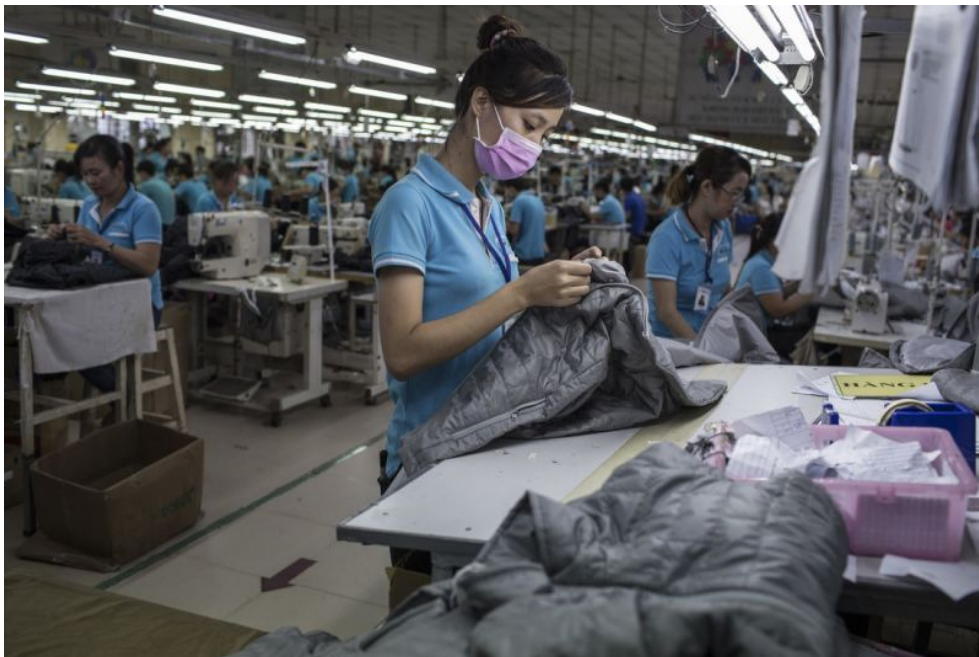
Una fabbrica a Dong Nai che produce abbigliamento per grandi marche di moda

Una volta ho visto il cartellino del prezzo di una camicia, era circa 104$. Una catena di produzione ha bisogno di 40 persone per produrne una. In un giorno, io ne faccio 200. L'azienda investe molto nei lavoratori, perché ce ne vogliono circa 40 per ciascun prodotto. Nonostante ogni giorno questi siano i risultati, l'azienda si lamenta di essere in perdita. Sono stata a parlare con il direttore per chiedere come mai non sono stata pagata, e mi ha detto che l'azienda sta attraversando una situazione difficile. Ma non sappiamo quale sia”.