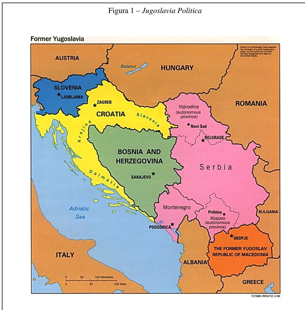
Figura 1 – Jugoslavia Politica

più che compromesse. Per diversi mesi, fino al gennaio 1992, in Krajina si perpetuò lo scontro tra esercito croato ed esercito federale jugoslavo. Il 15 gennaio del 1992 la CE – in seguito anche la Comunità Internazionale – riconosce ufficialmente la Croazia e la Slovenia come stati sovrani ed indipendenti.