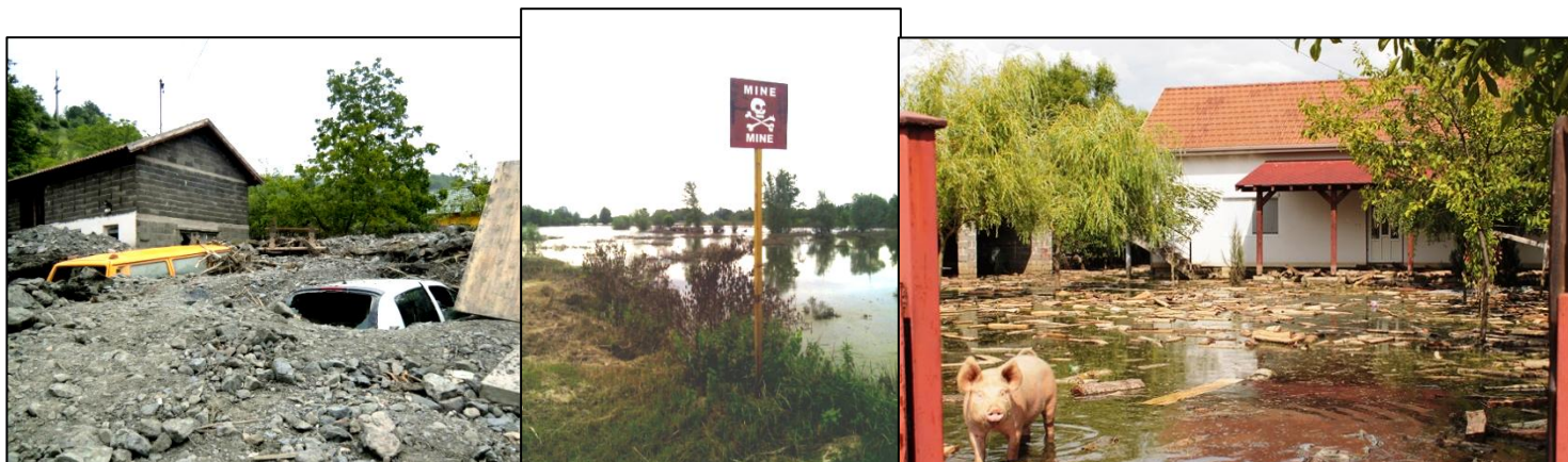
UNA FRANA A TOPČIĆ POLJE, I CAMPI MINATI ALLAGATI VICINO A BOSANSKI ŠAMAC, GLI ALLEVAMENTI DISTRUTTI A DOMALJEVAC