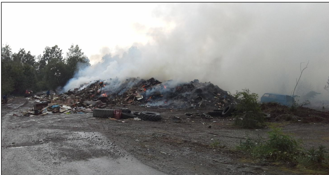
UNA DISCARICA IMPROVVISATA VICINO A BOSANSKI ŠAMAC DOVE SI BRUCIANO LE MASSE DI RIFIUTI IN MANIERA INCONTROLLATA