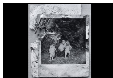
Srebenica, primavera 1996.

Nell'immaginario collettivo occidentale la morte è stata spesso rappresentata con scheletri, teschi, ossa umane, ma differentemente da disegni, dipinti e affreschi, la fotografia, rende massimamente visibile il degrado dei corpi ed il particolare evoca nel modo più macabro la morte nella sua indicibilità più inquietante. In altri termini l'effetto di foto di questo tipo (incentrate sul particolare della morte) è suscitare orrore nel suo senso reale, ovvero quel senso di confusione e di smarrimento che si prova di fronte ad una realtà che non si conosce, ad un evento naturale in sè stesso misterioso 3 . Ma Srebrenica non è un'immaginata cittadina in cui naturalmente capita che sia muoia in gruppo, Srebrenica è